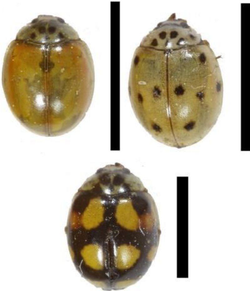
Adalia (Adalia) decempunctata (Linneus, 1758)