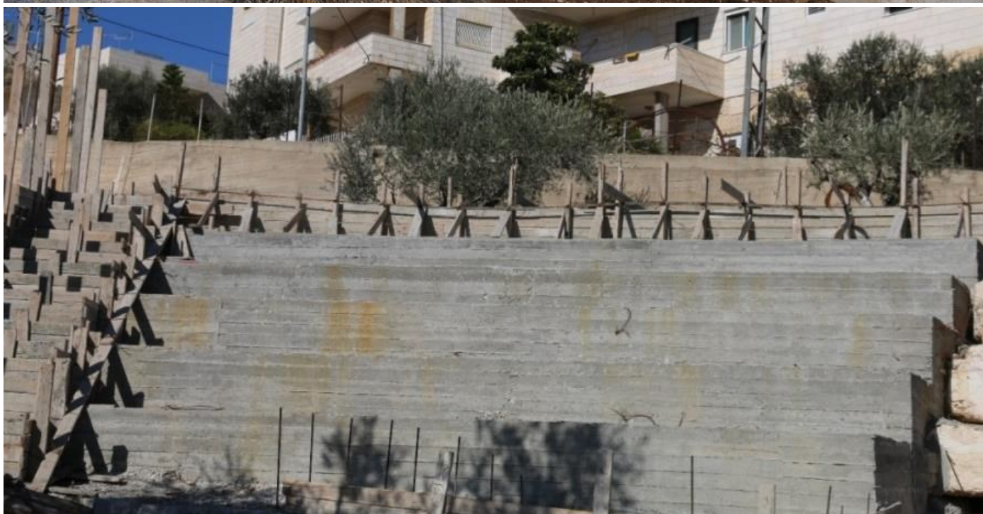
Area prima e durante lo sviluppo dell'infrastruttura. La foto in basso è la base concreta dell'anfiteatro educativo.

I fondi iniziali per questo lavoro provenivano dalla Fondazione Rotary, ma l'intenzione di portare tutto ad uno sviluppo più elaborato come descritto sopra e sotto in dettaglio ha richiesto e ricevuto un finanziamento complementare della Luogotenenza occidentale dell'Ordine equestre (USA), dal Parco giochi per la Palestina e dal Fondo di Gerusalemme che coprono collettivamente le spese per: a) infrastruttura per il giardino compreso un anfiteatro, terrazzamenti, suolo, legno ecc., b) Parco giochi e materiale dell'area esplorativa, c) Forniture per giardinaggio (attrezzi, semi ecc.), d) Programma sviluppo e attività (formatore, trasporto ecc.).