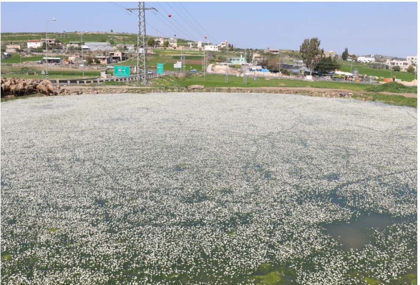
Picco di fioritura dello stagno Jinsafut nel febbraio 2018.

Abbiamo costruito nuovi modelli di sostenibilità, tra cui compostaggio, acquaponica, biogas, pioggia raccolta, energia solare (che copre tutti i nostri bisogni e altro), giardinaggio biologico, energia solare, e altro ancora. Abbiamo trasferito le conoscenze agli agricoltori e ai tecnici agricoli, ad esempio il primo progetto implementato ancor prima di aprire le nostre strutture è stato nel 2015, quando sono arrivati 12 ingegneri da Gaza è stato per imparare l'acquaponica nei nostri giardini. Abbiamo lavorato per la qualità ambientale con l'Autorità per la creazione di un piano di gestione per Wadi Al-Quff, protetto da Wadi Al-Zarqa al-Ulwi aree e ora lavorando su Wadi Al-Makhrour (vedi sopra sotto i progetti). Il nostro lavoro nella zona di Jinsafut (zona cuscinetto nell'area protetta Wadi Qana è un buon esempio di successo per la conservazione). Nonostante i nostri sforzi per localizzare altri ecosistemi simili, lo spadefoot un rospo siriano ( Pelobates syriacus ), già estinto in Giordania, non è stato trovato in nessun altro posto West Bank ad eccezione dello stagno Jinsafut. Abbiamo studiato i cambiamenti dello stagno attraverso le stagioni e riuscito a allevare i girini ex-situ e restituirli con successo. Le misure che abbiamo preso sul il terreno ha anche aiutato a proteggere questo rospo e l'ecosistema in via di estinzione in cui vive, incluso lo stagno Water-crowfoot ( Ranunculus peltatus ) e la lenticchia d'acqua ( Lemna minor ).