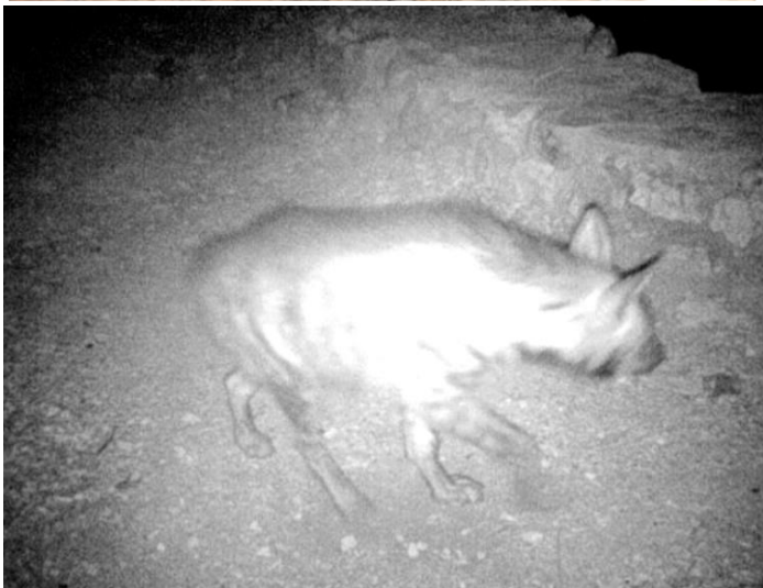
Lena a strisce documentata dalla foto-trappola ad Al-Makhroun

Un esempio dei risultati sorprendenti iniziali è la raccolta di dati sui mammiferi tipici in questo Sito patrimonio mondiale. Ad esempio, utilizzando un dispositivo di ecolocalizzazione, abbiamo esaminato la fauna pipistrello della valle e registrato dieci specie conosciute e due sconosciute (un pipistrello della frutta e 11 pipistrelli insettivori). Delle dieci specie identificate finora, alcune sono piuttosto rare (ad esempio, Taphozous perforatus ) o registrato per la prima volta ( Pipistrellus pipistrellus ) nei territori palestinesi occupati. Abbiamo utilizzato anche trappole fotografiche e registrato mammiferi più grandi comprese le gazzelle, iene, volpi, sciacalli, irace e gatti selvatici. I dati raccolti dal nostro team di ricercatori in questa valle molto speciale saranno analizzati e utilizzati nelle campagne di educazione per la locale comunità palestinese confinante nella valle, poiché stimoliamo anche l'economia locale attraverso piani per ecoturismo e mantenimento delle pratiche agricole tradizionali.